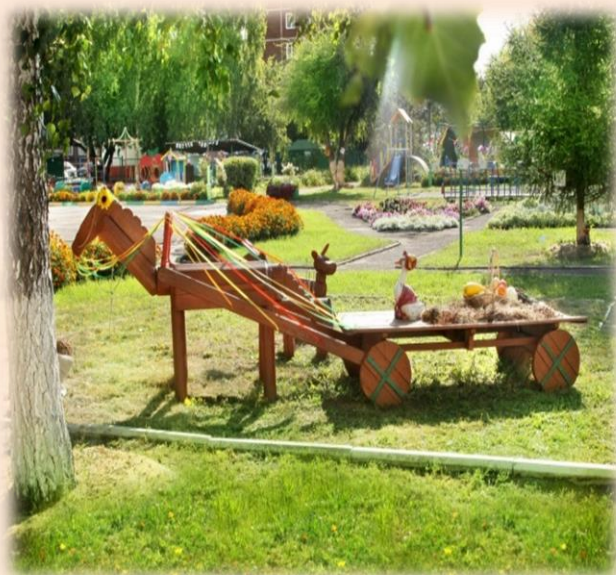
Точка «Деревенское подворье»