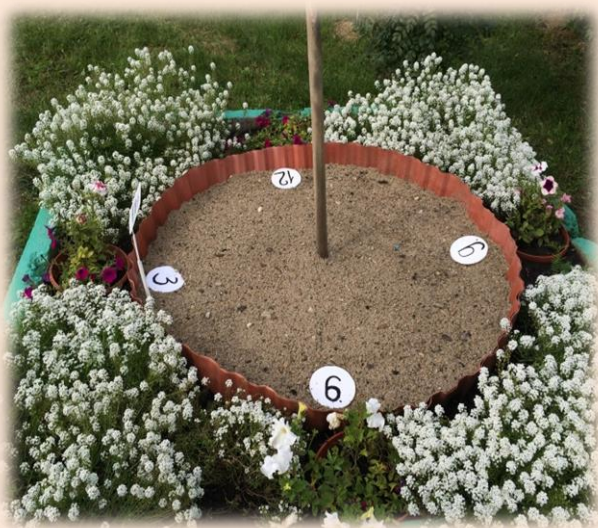
Точка «Солнечные часы»