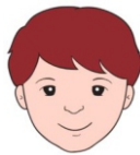
Радостный, веселый довольный