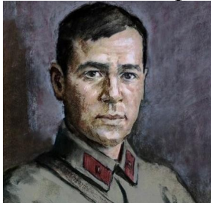
( Муса Джалиль политрук)

Рассмотрите иллюстрации связанные с жизнью Мусы Джалиля и назовите событие, либо фамилии: