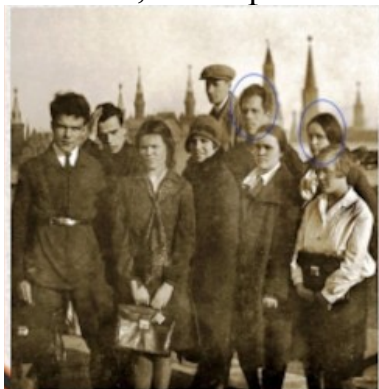
( Муса Джалиль студент МГУ)

Рассмотрите иллюстрации связанные с жизнью Мусы Джалиля и назовите событие, либо фамилии: