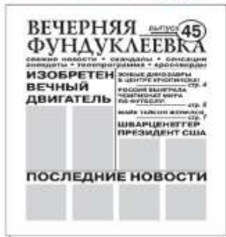
Модульная сетка (слева) и сверстанная по ней первая полоса (справа)