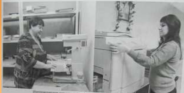
Иллюстрация деятельности работников не только для жителей Бобровского района