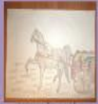
Илья Репин. Мой солдат. 1876 г.