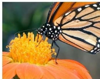
пыльцой и нектаром