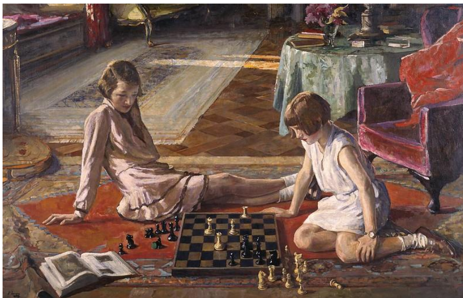
Sir John Lavery - The chess players. 1929 Джон Лавери. Шахматистки. 1929