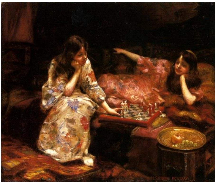
Генри Сиддонс Моубри. Игра в шахматы, 1890.

- Что объединяет все эти картины? (на всех картинах изображены ДЕТИ, играющие в шахматы). Захотелось ли вам научиться играть в шахматы?