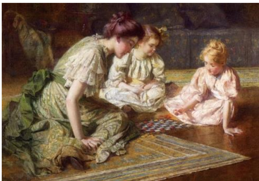
Francis Coates Jones