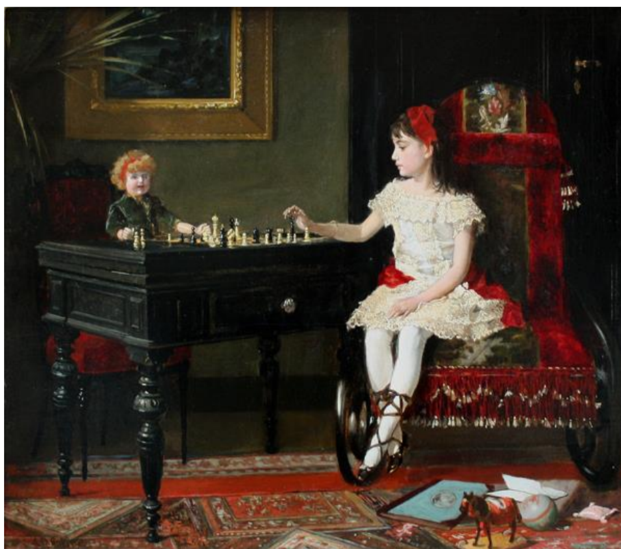
Александр Деметриус Гольц. Девочка с куклой, 1900

- Приглашаю вас посетить выставку картин. Как вы думаете, чему она посвящена?