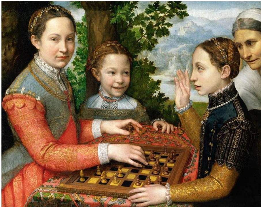
Софонисба Ангвиссола. Портрет сестёр художницы, играющих в шахматы. 1555