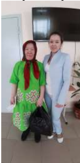
Фотография 15. «Работа с родителями КМНС»