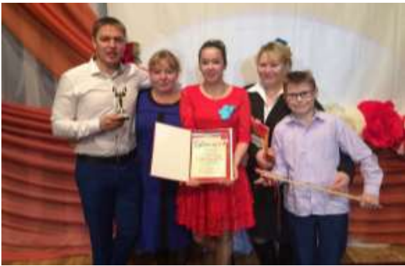
Фотография 11. «Конкурс «Лучший специалист – 2017 года»»