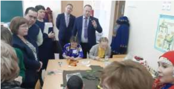
Фотография 13. «Координационный совет по вопросам сохранения родного языка»