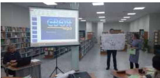
Фотография 9. «КПК «Содержание современного технологического образования»»

Системность профессионального образования носит постоянный характер, через курсы повышения квалификации, активно принимаю участие в методических объединениях, как на школьном уровне, так и на районном уровне. Принимаю и делюсь опытом работы с коллегами. Принимаю участие в профессиональных конкурсах (см. фотографии 9-16).