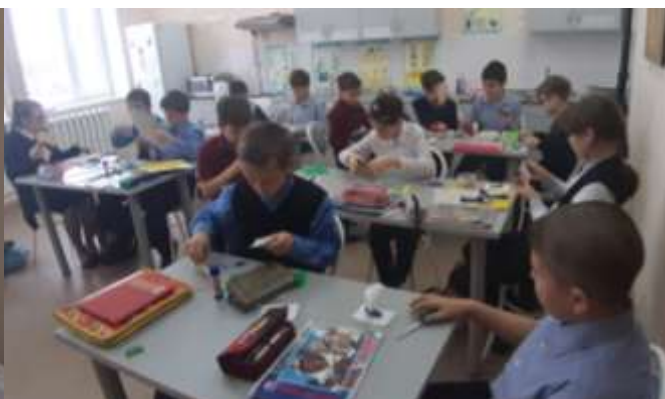
Фотография 2. «Реализация мини-проекта на уроках технологии и ИЗО «Малые скульптуры»

Знакомство с профессиями швейного производства, овладение навыками кройки и шитья, выполнение мини-проектов дали свои плоды. Обучающимся представилась возможность принять участие в профессиональных пробах, дети приняли участие в проекте «Изготовление сувенирной продукции» и были официально трудоустроены на работу ООО «Надежда» в качестве сборщиков сувенирной продукции, проработав 2 месяца (см. фотографии 3-8).