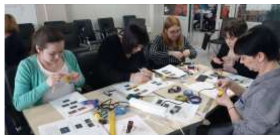
Фотография 10. «КПК «Современные форматы преподавания уроков технологии»»