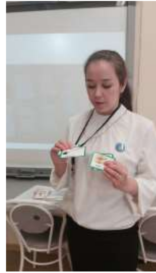
Фотография 16. «Выступление на методическом совете учителей родного языка»