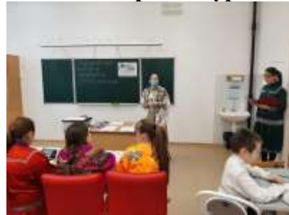
Фотография 14. «Фронтальный диктант на хантыйском, мансийском языках»