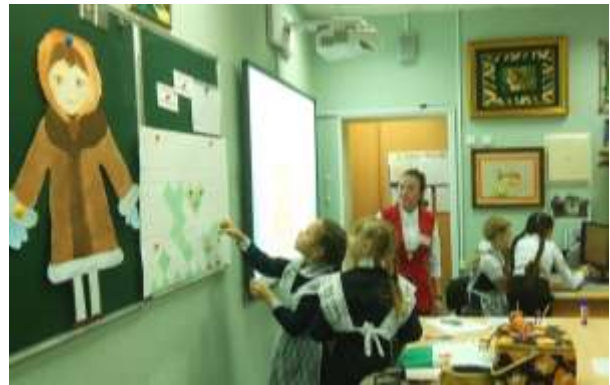
Фотография 12. «Конкурс «Учитель года 2018». Открытый урок»