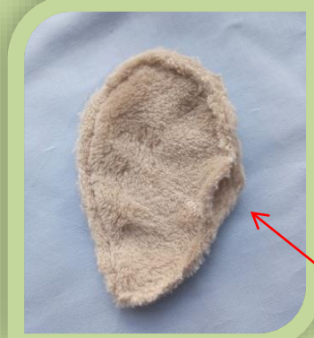
Прошить швом «Назад иголлка» или на швейной машине, оставляя отверстие