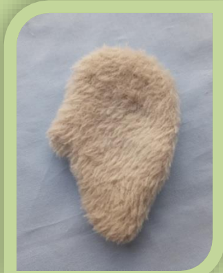
Вывернуть. Чуть- чуть наполнить синтепоном, зашить отверстие потайными стежками