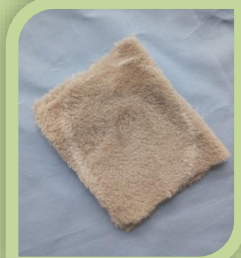
Сложить пополам и мелом нарисовать капельку