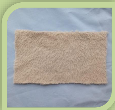
Выкроить прямоугольник 10x8см