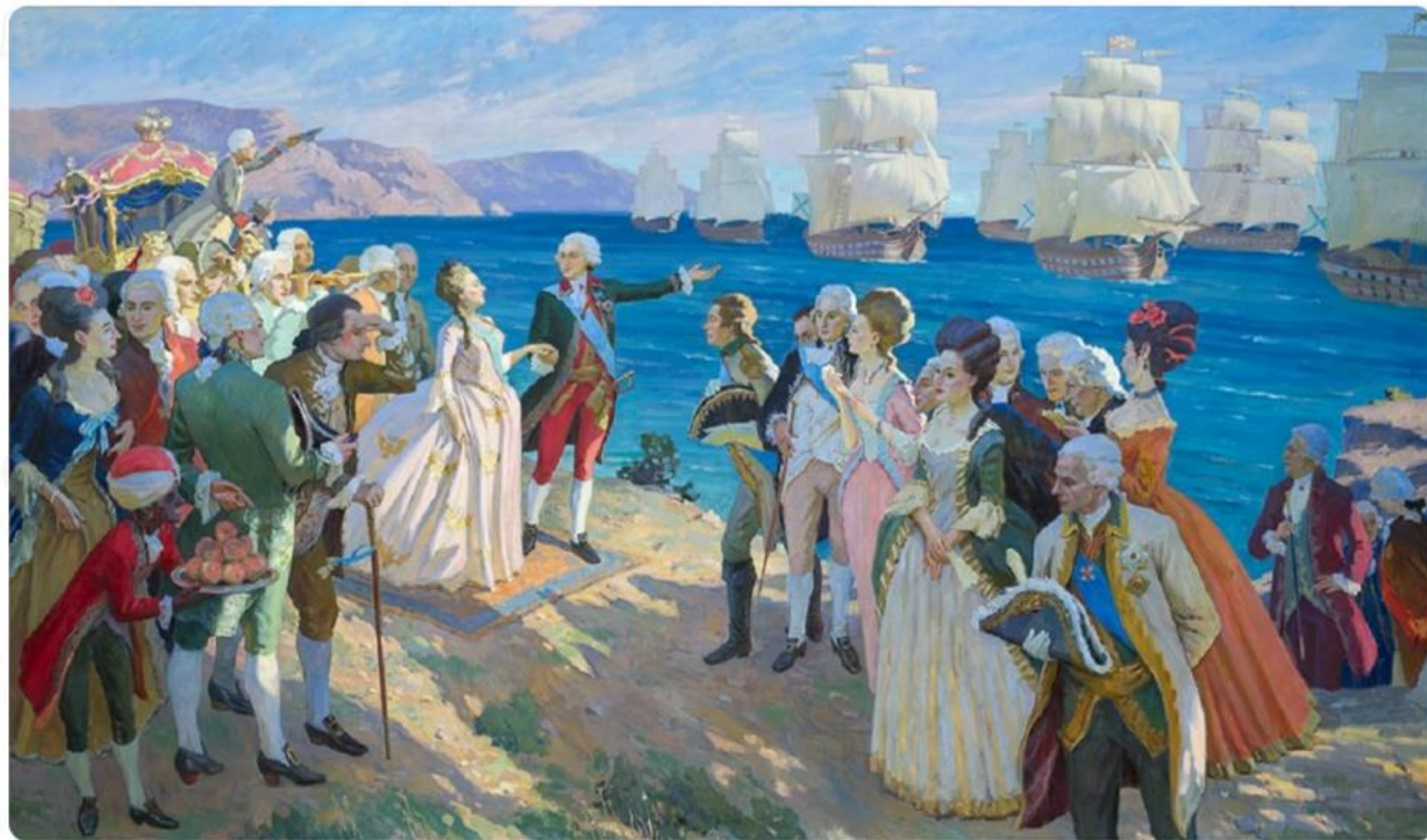
Худ. А.В. Щемлинский, «Потемкин представляет Черноморский флот Екатерине II»