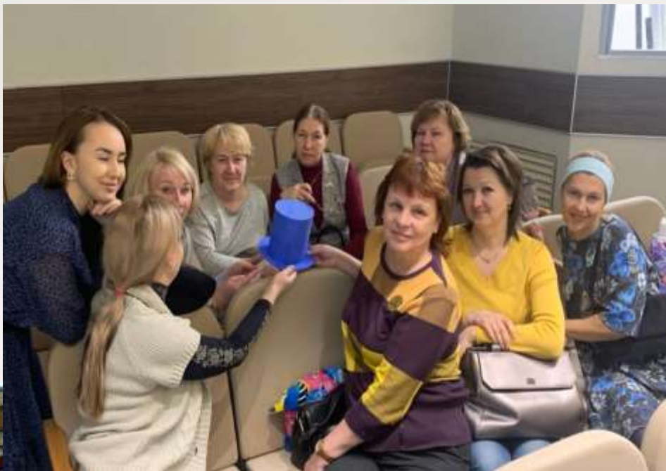
Группа педагогов начальной школы

начале и конце мыслительной сессии для постановки целей, определения стратегии обсуждения;