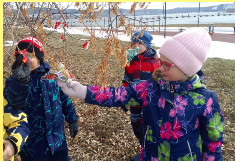
Праздник Жаворонка - Встреча весны

Провели мероприятия «Встреча весны», «В гостях у Василисы», «Посиделки в избе»