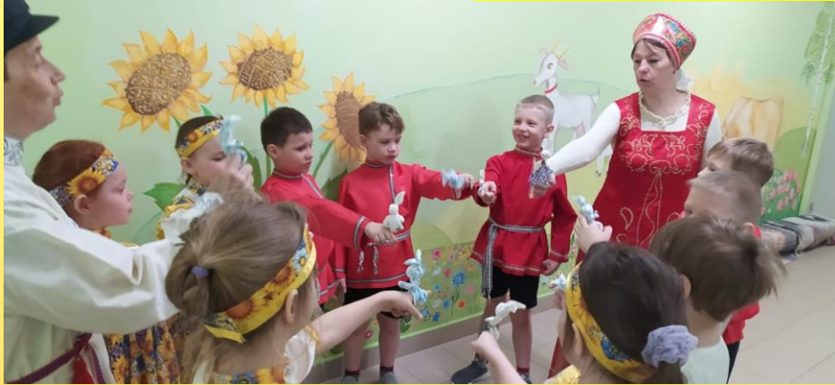
Игра «Волк и зайцы»