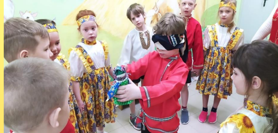
Игра «Бабушка Арина»