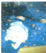
Это наш кот - Снежок.