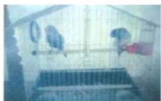
Попугай - Кеша и Даша.