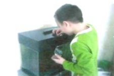
Ш и их питомцы