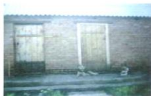
Шарик и Рокки