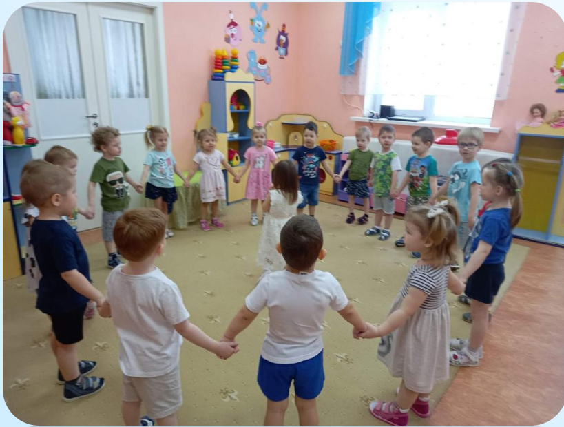
Хороводная игра «Именины».

Народная игра с движениями «Кто позвал?».