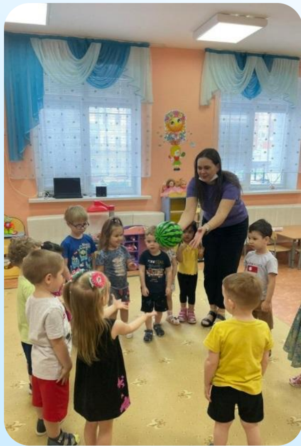
Игры в круге