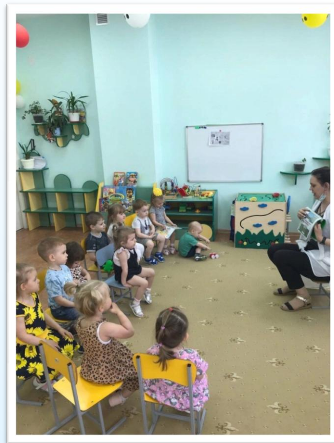
Чтение художественной литературы