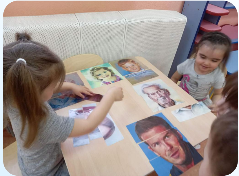
Игра « Сложи портрет»