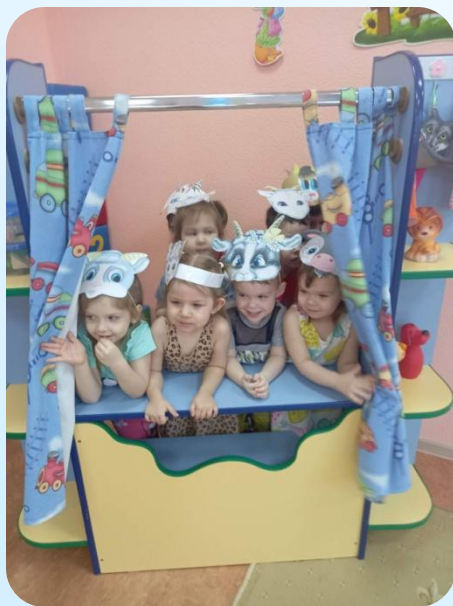
«Волк и семеро козлят»