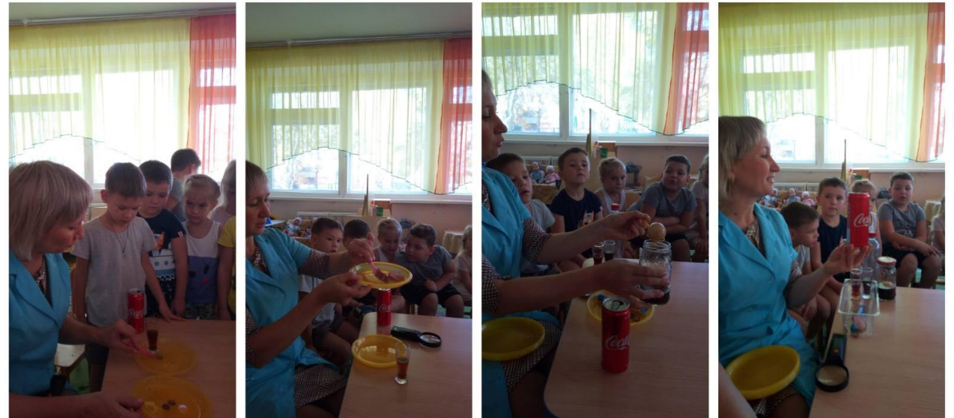
(Опытно –экспериментальная деятельность «Что содержится в кока –коле?»)