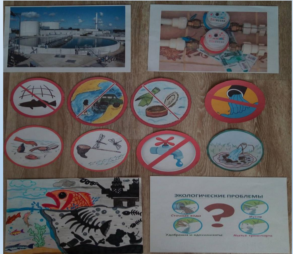
(Работа с экологическими знаками «Береги воду и рыбные ресурсы, как основные продукты питания»)