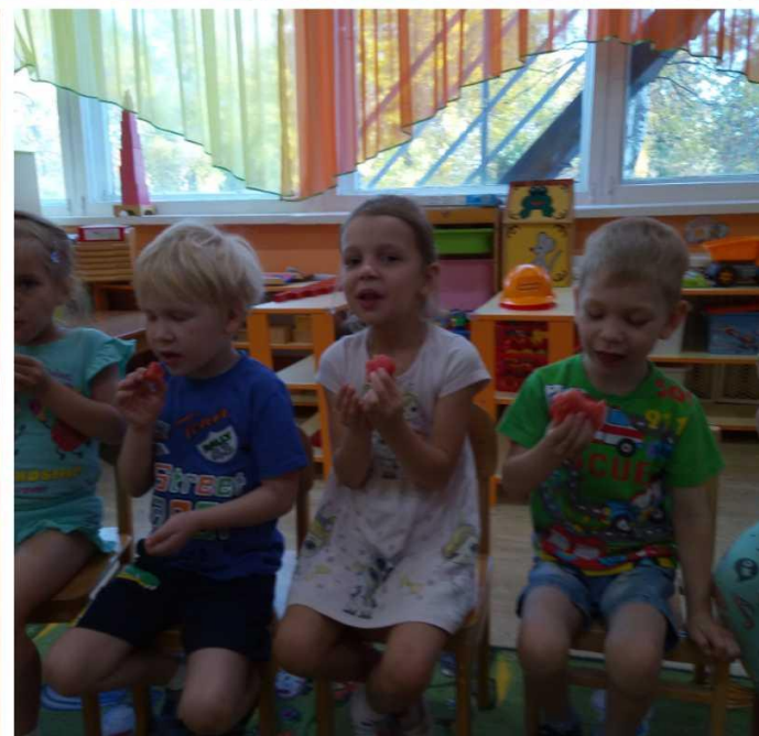
(Беседа на тему: «Нитраты-вредны ли они для человека?»)