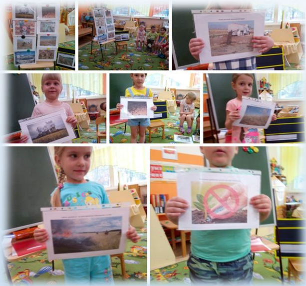
(Рассматривание альбома «Экологические факторы, снижающие урожайность»)