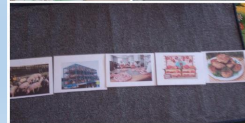
Настольно –печатные игры «От фермы до стола», «Собери семью»