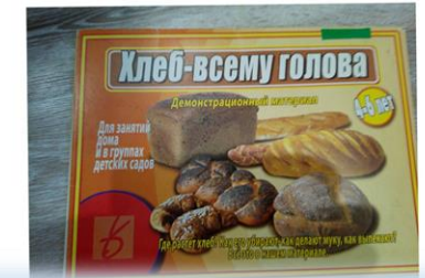
(Ситуативный разговор «От зерна до булочки»)