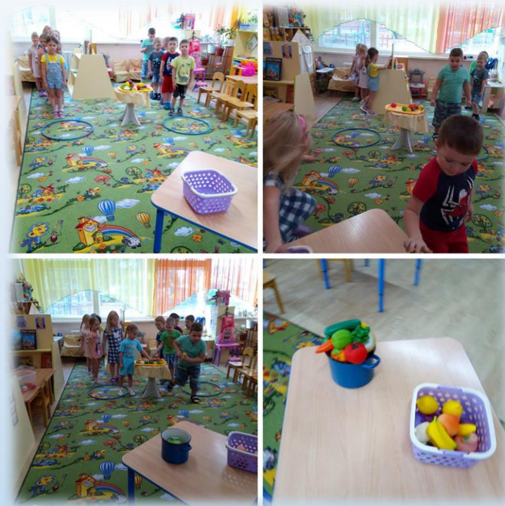
Ди «Сварим компот/сварим борщ»