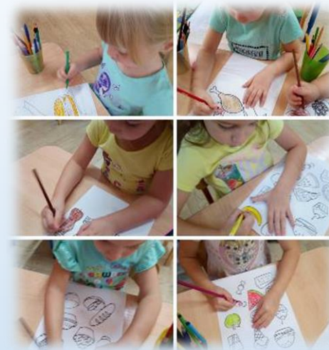
рисование в раскрасках «Полезные – вредные продукты»