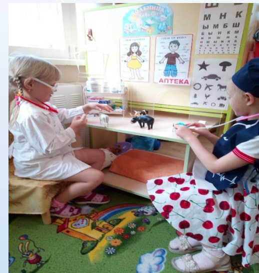
Сюжетно –ролевая игра «Ветеринарная клиника»