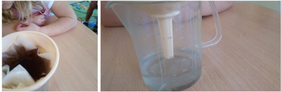
(Опытно –экспериментальная деятельность «Фильтрация воды»)