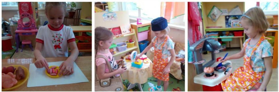
Сюжетно –ролевая игра «Животноводы»