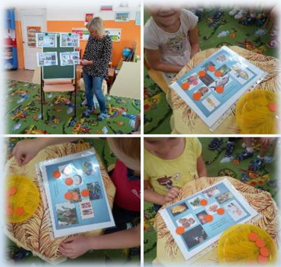
(д/и «Меню для сказочных героев»)