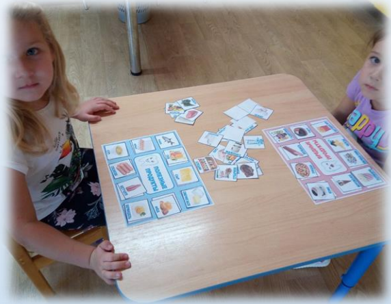
(настольно –печатная игра «Полезные –вредные продукты»)