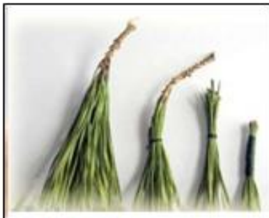
40 000 лет назад