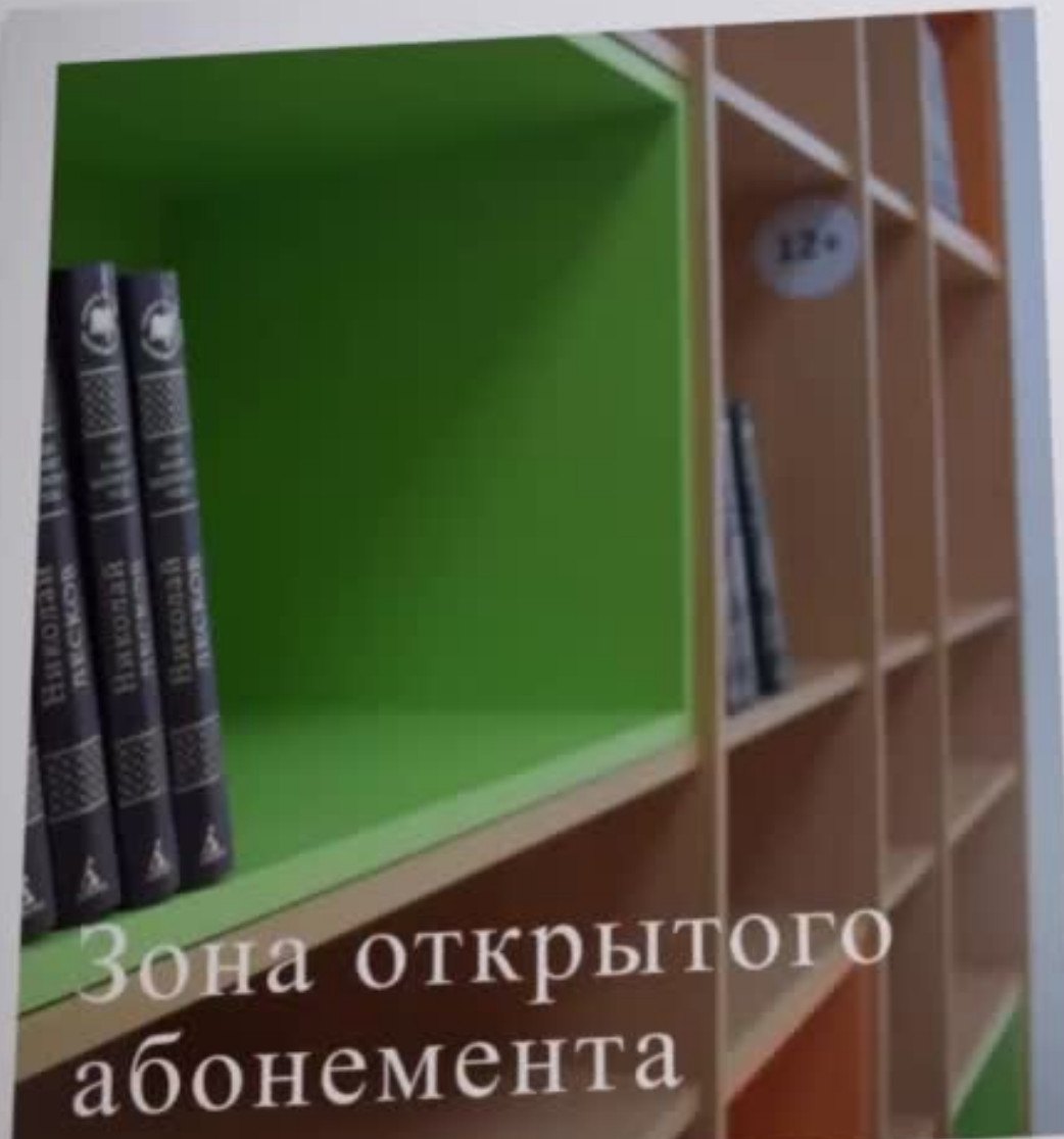
Зона открытого абонемент