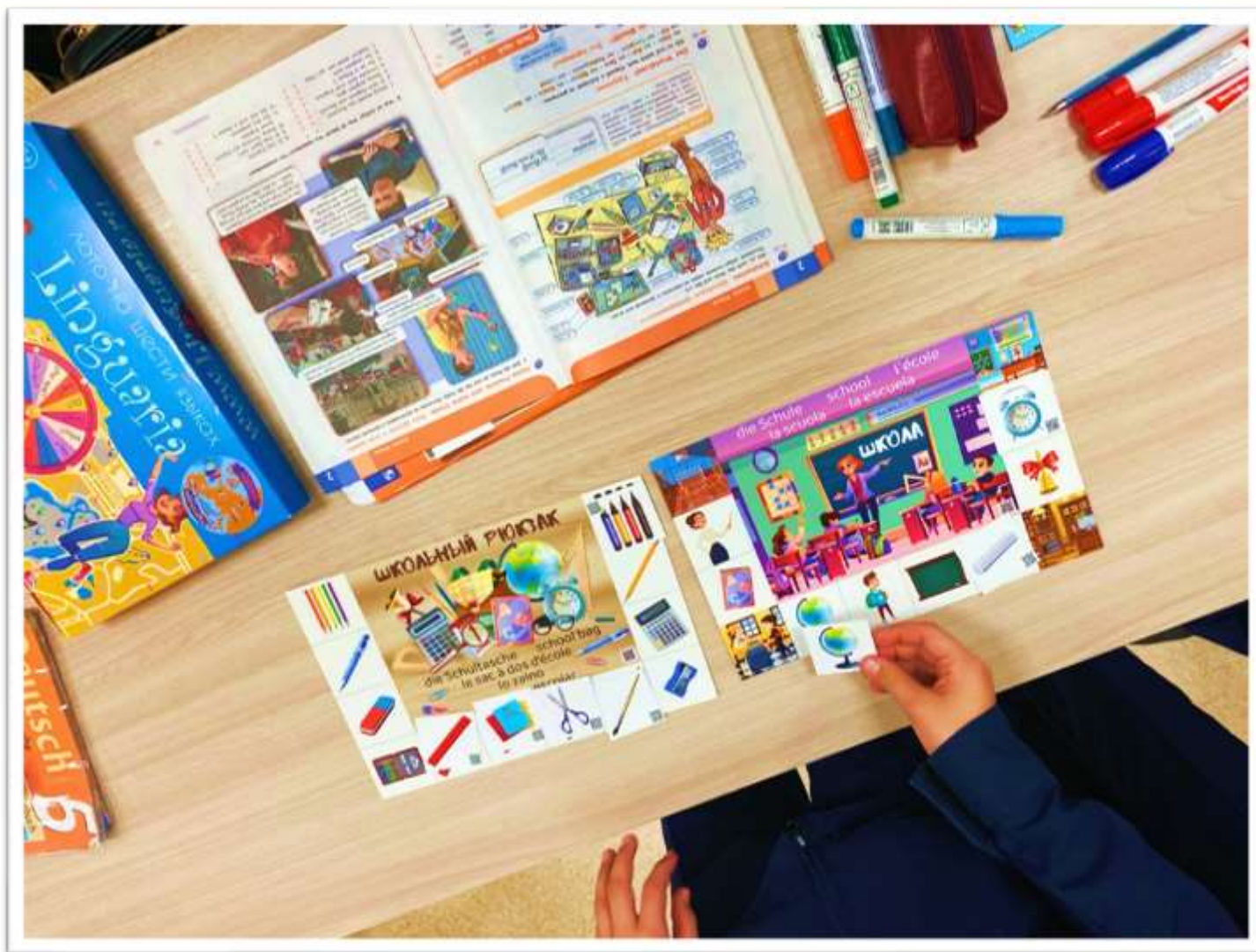
Дополнительное образование «Немецкий язык» „Schulsachen“, 5 класс