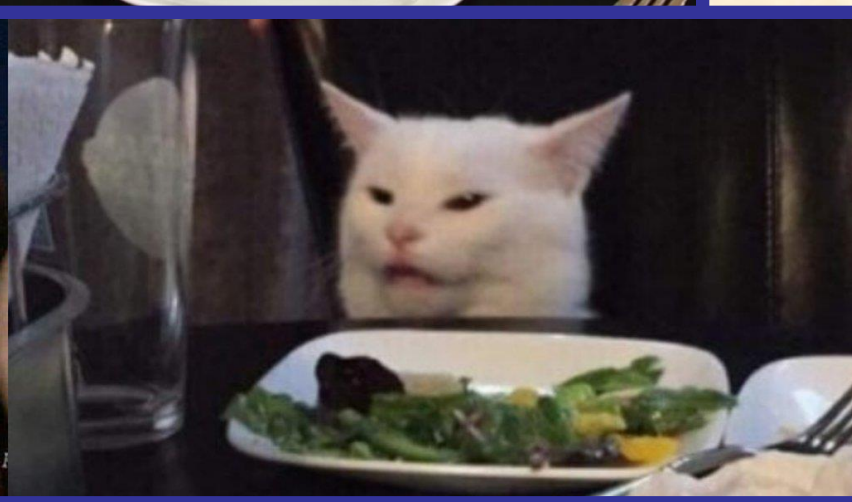
Обыгрывание мема «Девушки и кот» [Выпуск 8 «Как раскрасить кошку»]