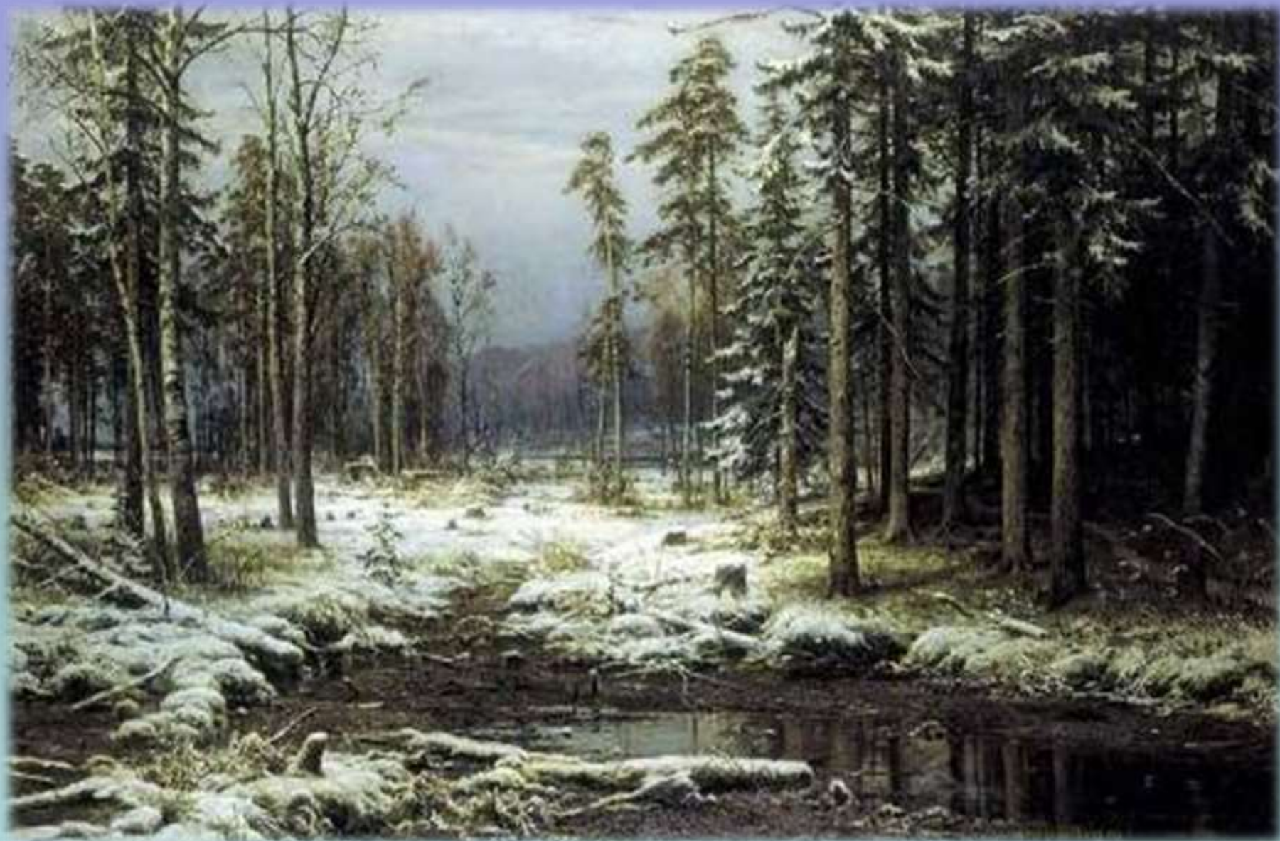
И. Шишкин «Первый снег»