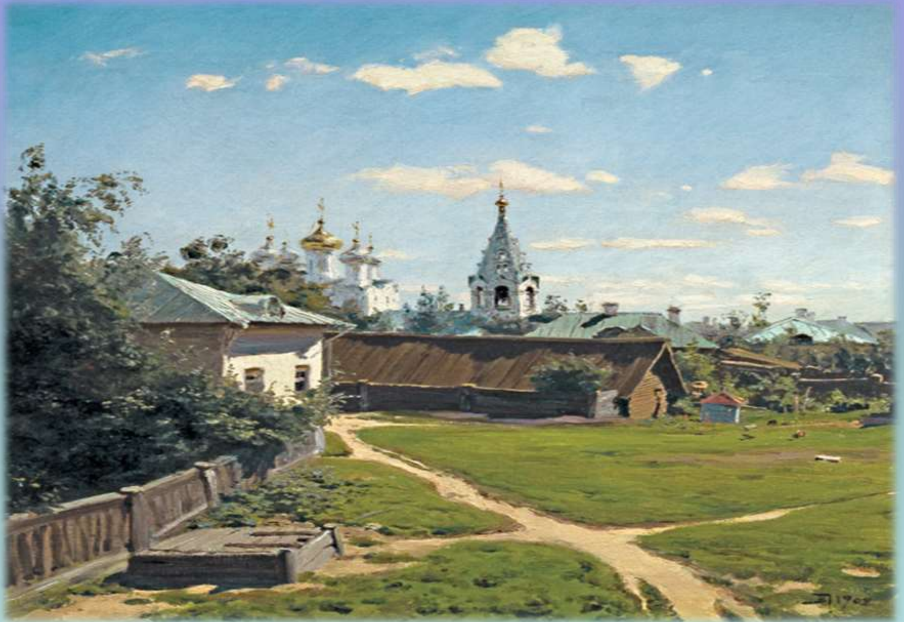
В. Поленов «Московский дворик»