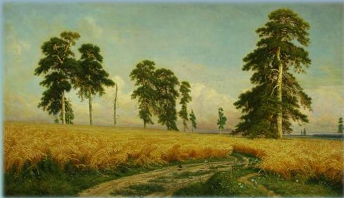
И. Шишкин «Рожь»