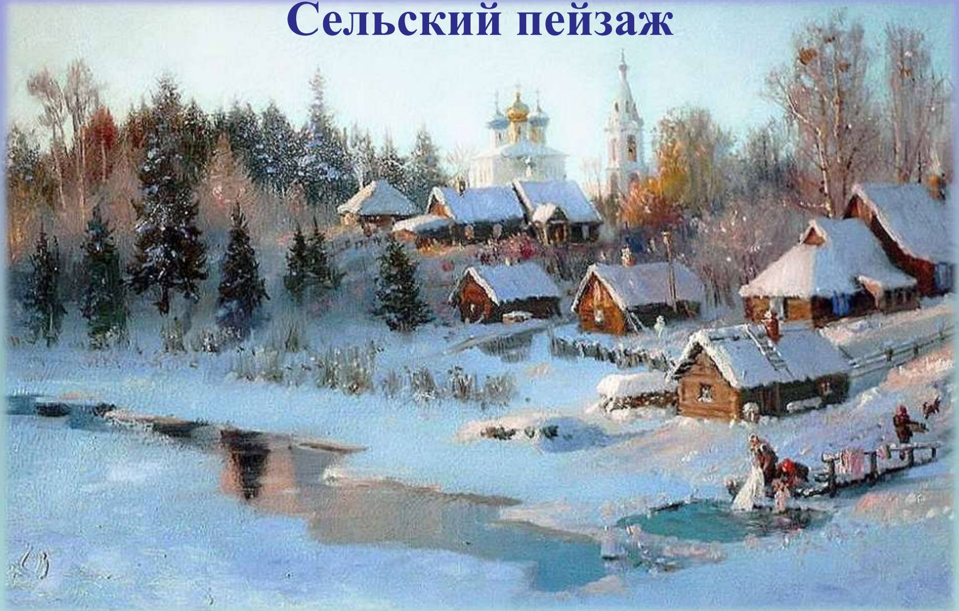
В. Жданов «Далеко-далеко»