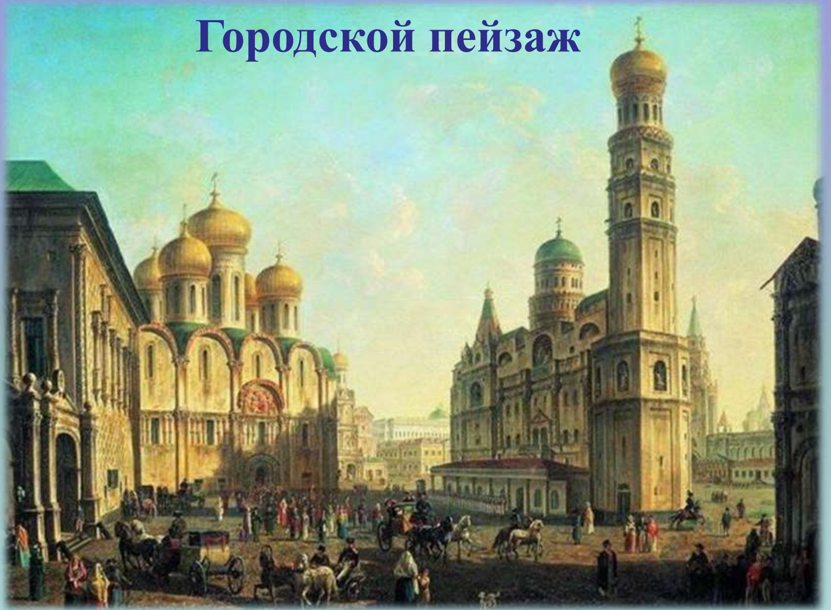
Ф. Алексеев «Соборная площадь в Москве»