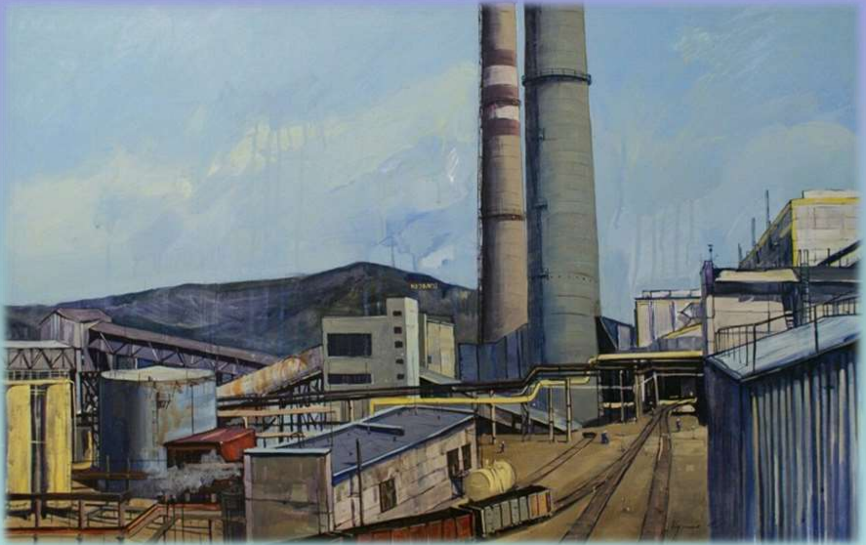
Л. Мурина «Кемеровская ГРЭС»