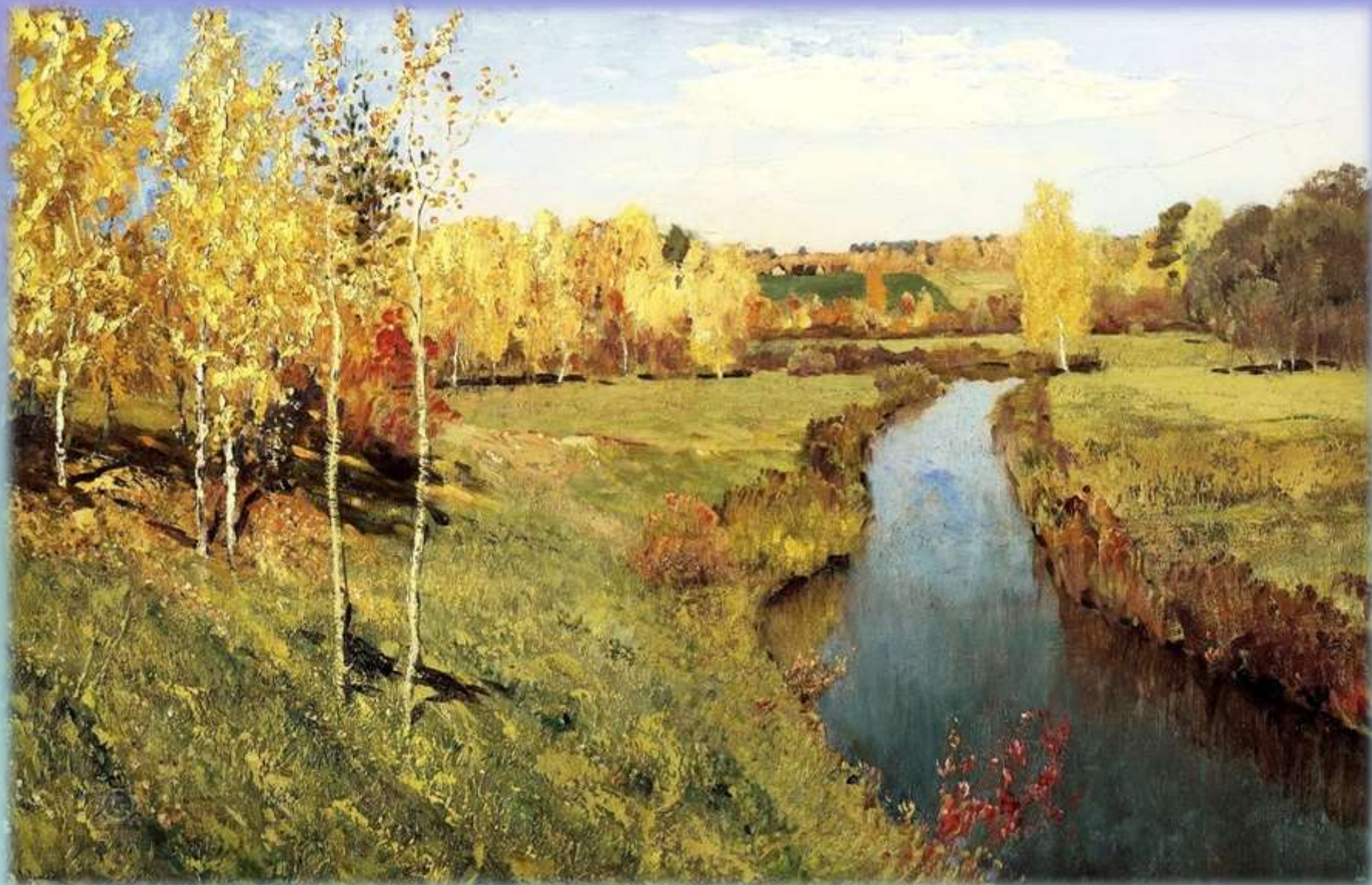
И. Левитан «Золотая осень»