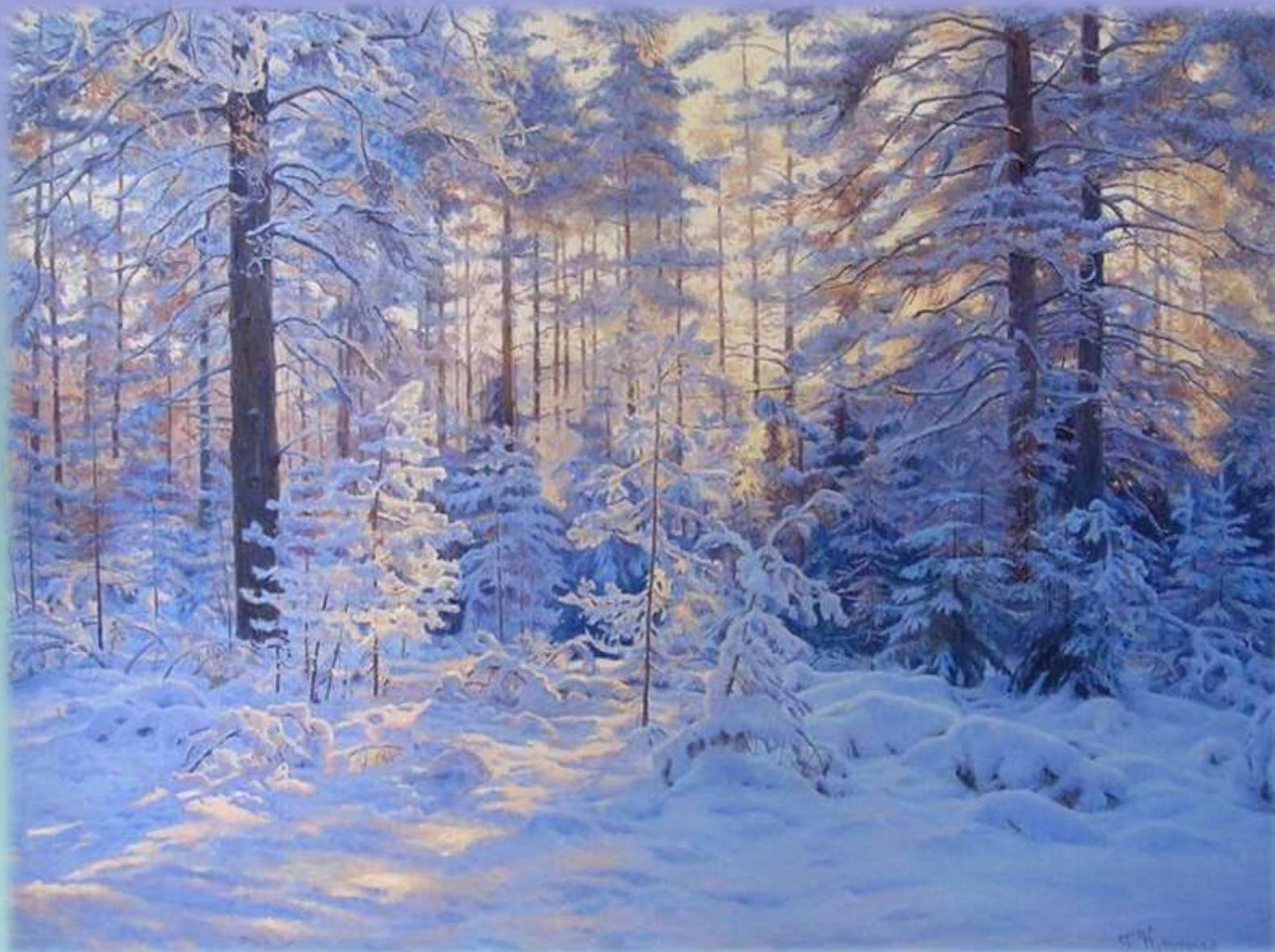
Г. Кириченко «Зимний лес»