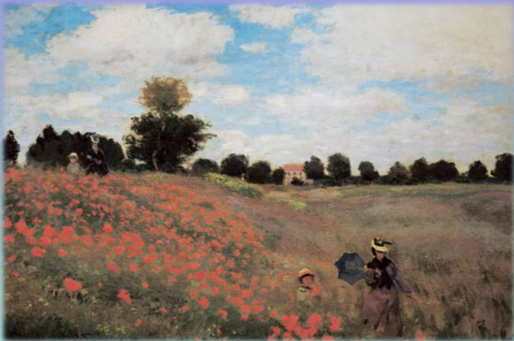
К. Моне «Поле с маками»