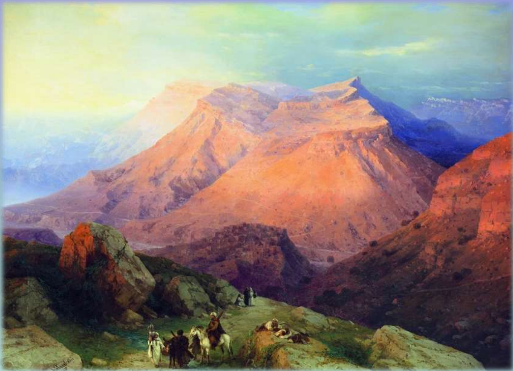
И. Айвазовский «Аул Гуниб в Дагестане»