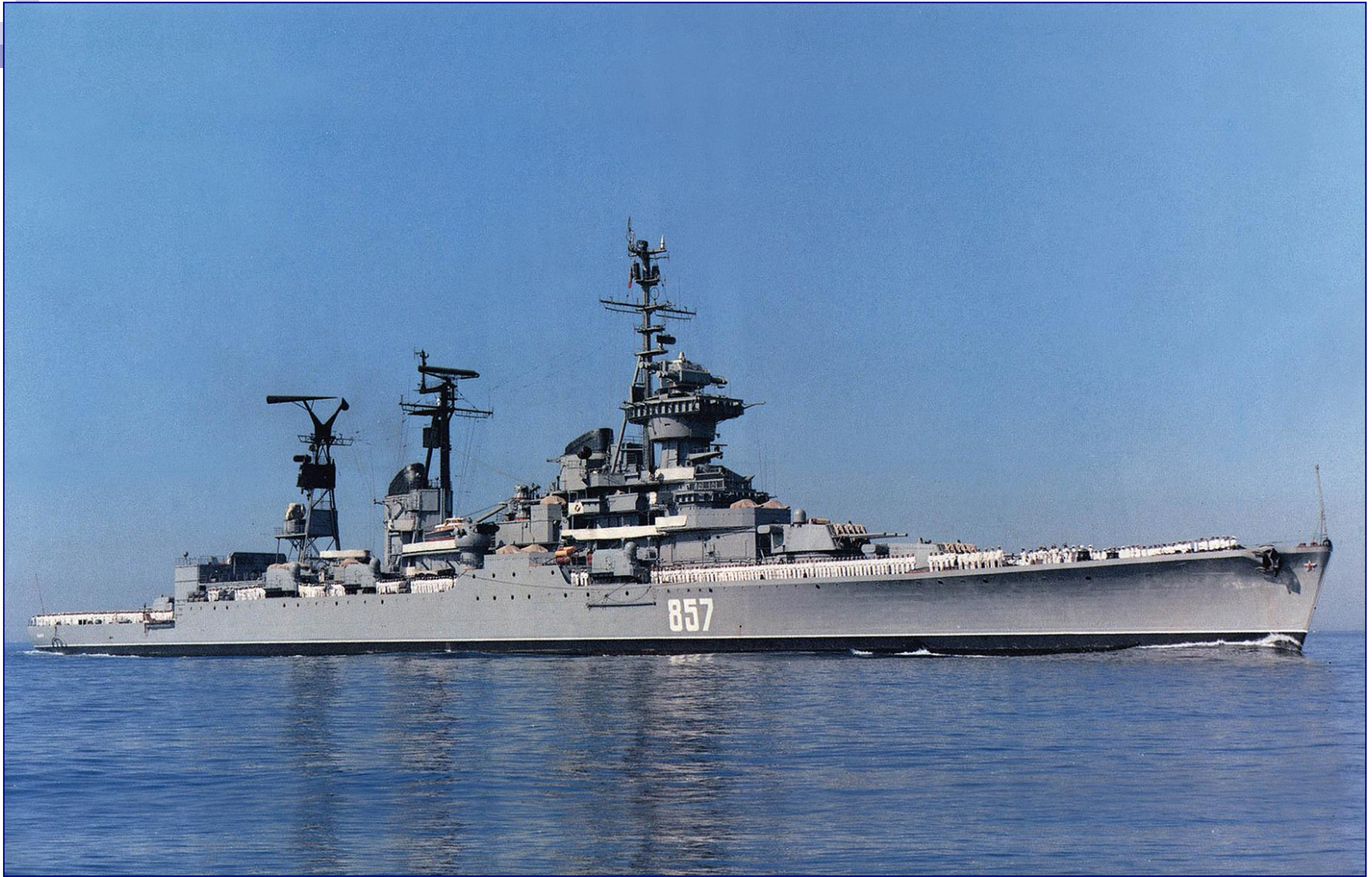
Ракетный крейсер Балтийского флота «Александр Невский»