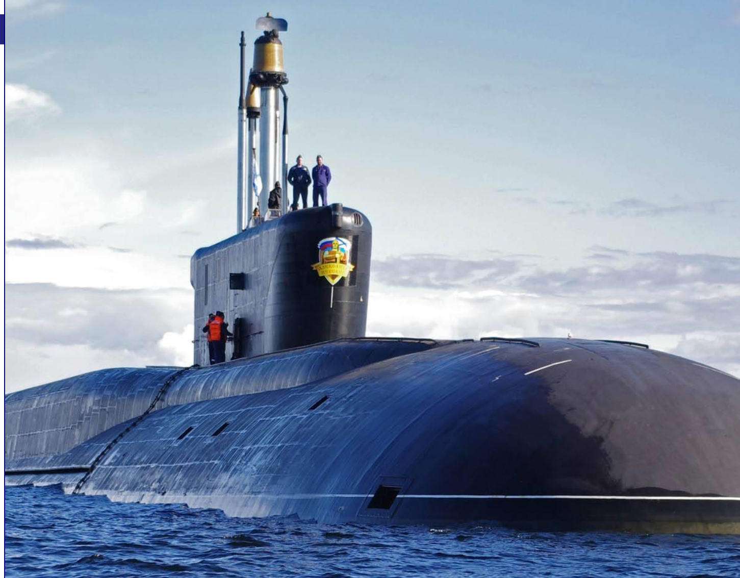
Атомная подводная лодка «Александр Невский»