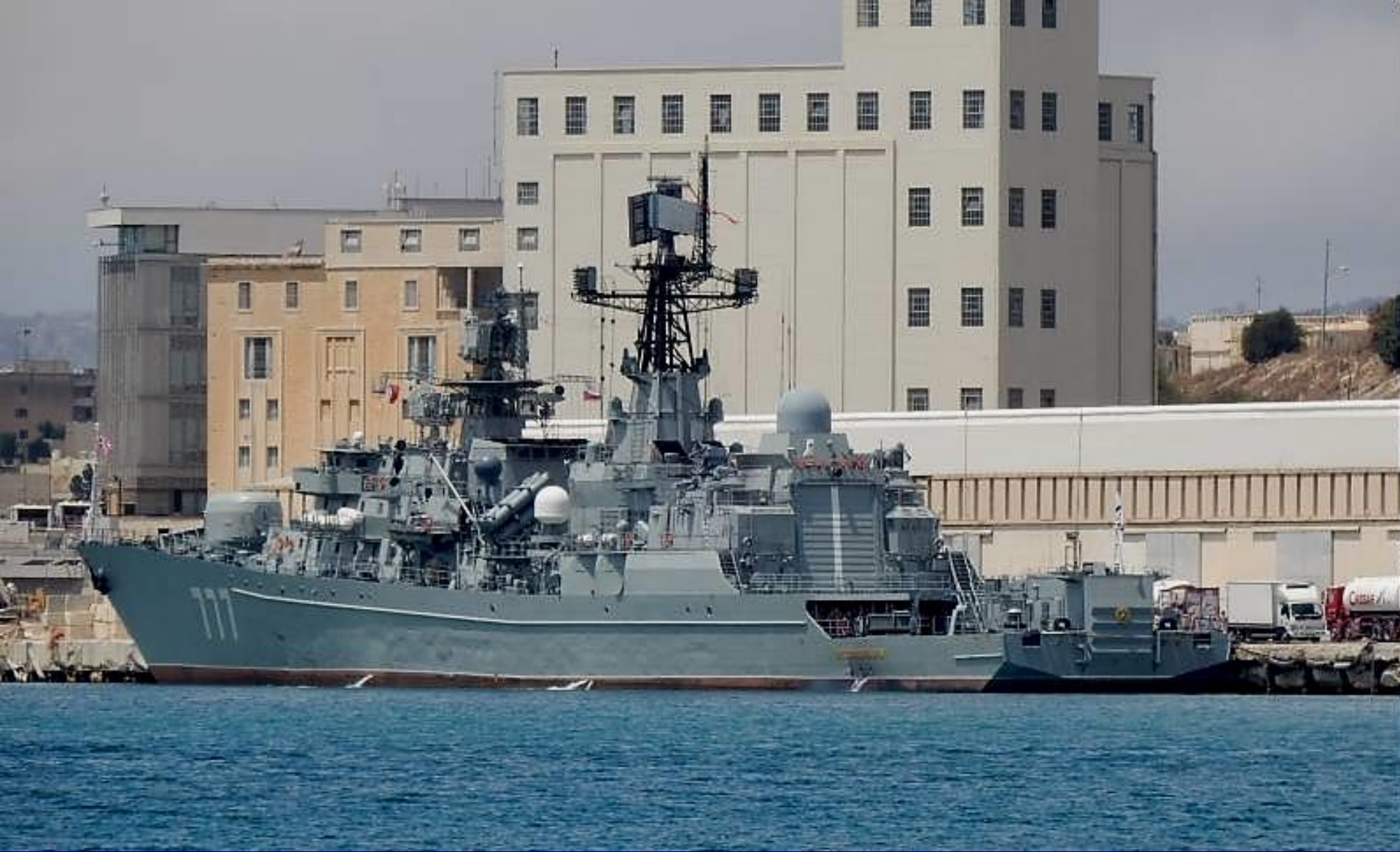
Сторожевой корабль «Ярослав Мудрый»