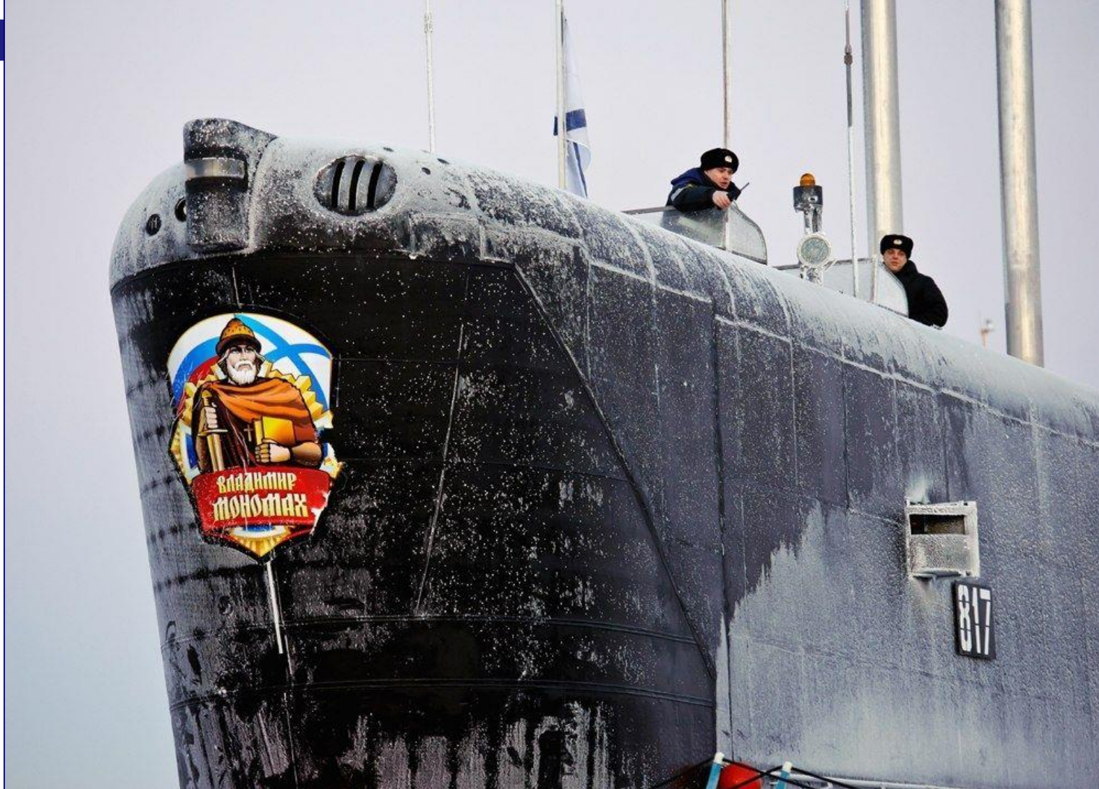
Атомная подводная лодка «Владимир Мономах»