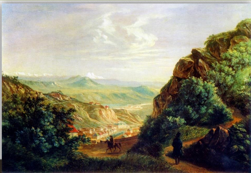
Вид Пятигорска. 1837-1838гг.