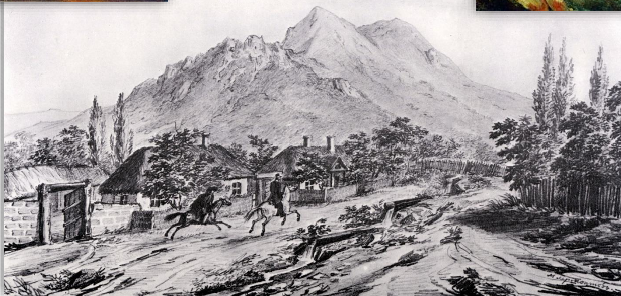
Бештау близ Железноводска. 1837г.