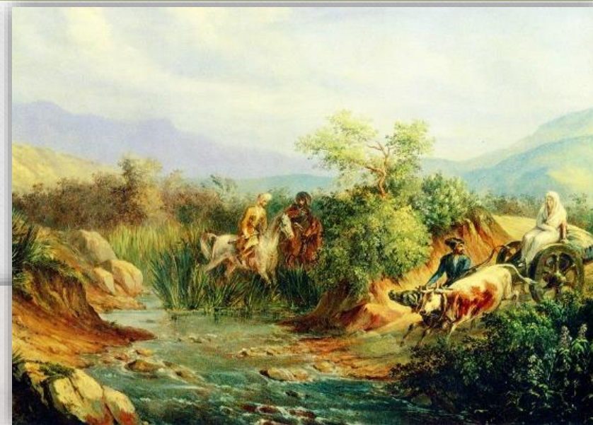
Нападение. Сцена из кавказской жизни. Масло. 1837 г.