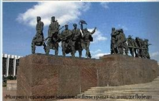
Монумент героическим защитникам Ленинграда на площади Победы