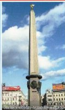
Обелиск городу-герою Ленинграду