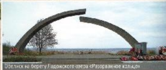
Обелиск на берегу Ладожского озера «Разорванное кольцо»