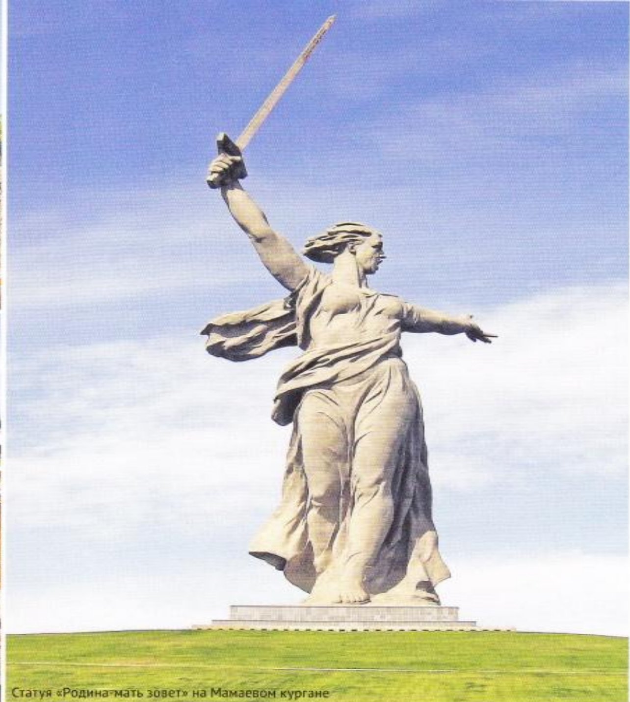
Статуя «Родина-мать зовёт» на Мамаевом кургане