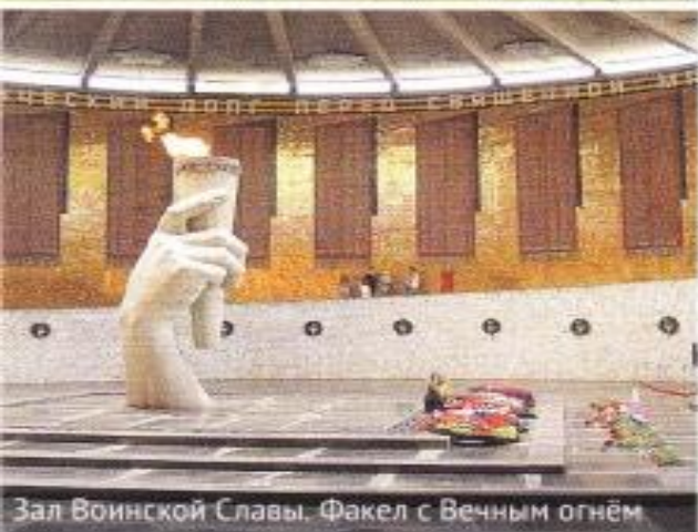
Зал Воинской Славы. Факел с Вечным огнём