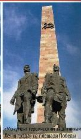
Монумент героическим защитникам Ленинграда на площади Победы