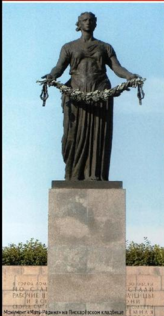
Монумент «Мать-Родина» на Пискаревской кладбище